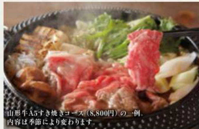
山形牛A5すき焼きコース(8,800円)の一例 内容は季節により変わります

料理はそれぞれに出される個人盛りスタイルです 混み合う日はお早めのご予約がおすすめです