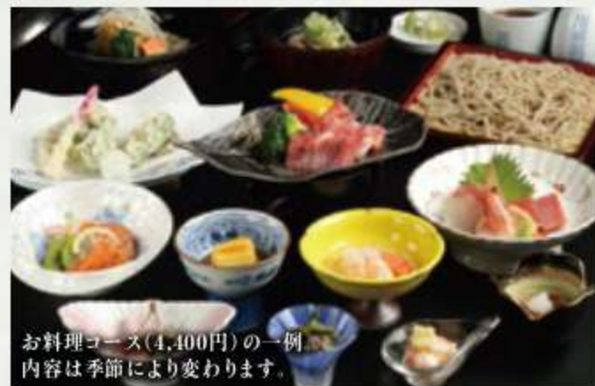
お料理コース(4,400円)の一例 内容は季節により変わります

格式ある蔵座敷を貸切りでご利用ください ご家族のみのご法事・ご慶事にもご利用いただけます